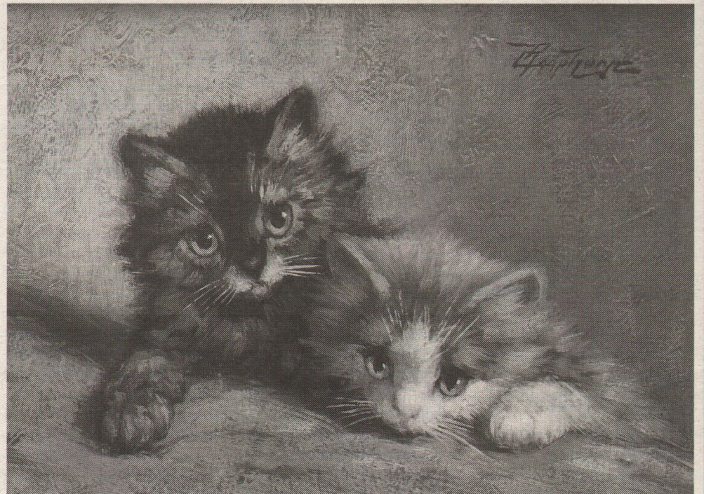
C. Raaphorst, 18 x 24 cm: tweeduizend per poes.

Er zijn twee goede argumenten om het gebruik van kongsvorming moreel te verwerpen: ten eerste wordt het marktmechanisme van vraag en aanbod gefrustreerd en verstoord en ten tweede is de onwetende inbre-